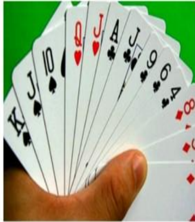
Der Bridgeclub lädt dazu ein, dieses Kart

TECKLENBURG-LEDDE. Der Bridgeclub Tecklenburger Land bietet einen Anfängerkursus für alle, die das faszinierende Kartenspiel erlernen möchten. Er startet am 29. April (Dienstag) um 18 Uhr im Dorfgemeinschaftshaus Ledde. Egal ob jung oder alt – Bridge trainiert das Gedächtnis, macht Spaß und verbindet Menschen, heißt es im Presse-