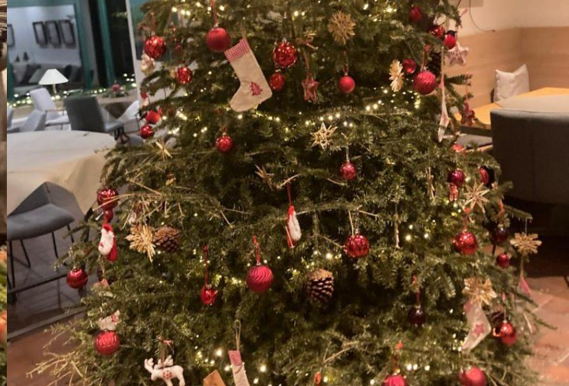
Weihnachtsfeier im Golfclub Tecklenburger Land