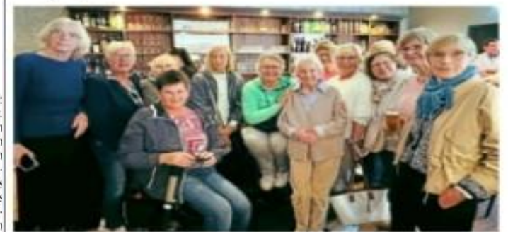
Die zwölf Teilnehmerinnen aus dem Tecklenburger Land und Emsdetten erlebten ein unterhaltsames Turnier.

spannt und man hatte eine Menge Spaß mit den Niederlandern, heißt es abschließend im Pressemitteilungstext.