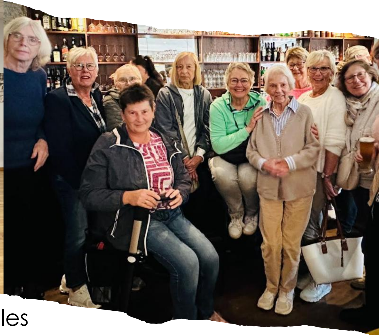
27. September Kneipenturnier in Emmen