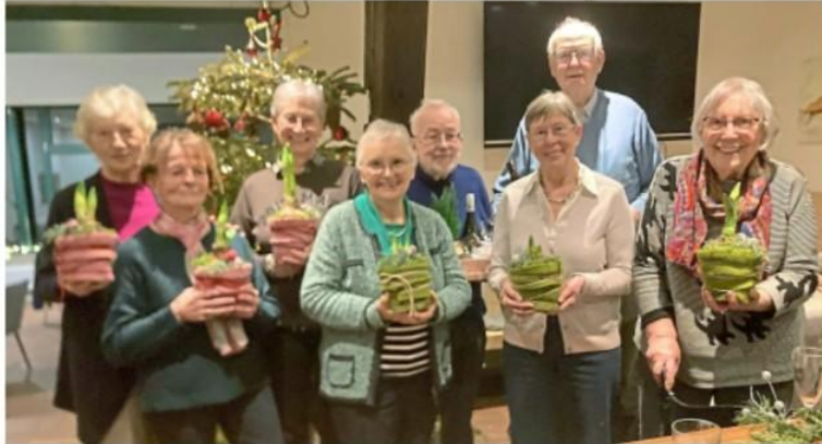
Für die Gewinner des Weihnachtsturniers gab es Präsente.