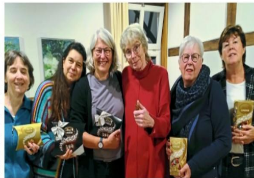
Die Bridgespieler des Clubs Tecklenburger Land freuen sich über ihre Erfolge.

Club in der Bundesliga vertreten. Der Bridgeclub freut sich über die Unterstützung und das Interesse der lokalen Gemeinschaft. Alle Bridge-Enthusiasten sind eingeladen, das Team auf seinem Weg in der Bundesliga zu begleiten. Weitere Informationen zu Terminen und Aktivitäten finden sich auf der offiziellen Website des Bridgeclubs Tecklenburger Land unter www.teutobridge.de .