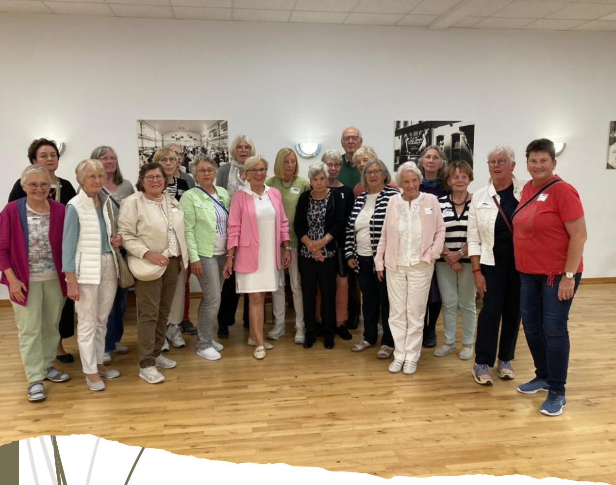
24. August Offenes überregionales Paarturnier in Ibbenbüren